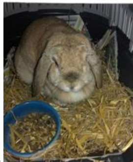
...met Pip is Vip op locatie...