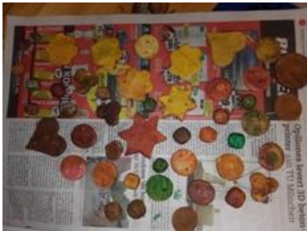
...kleurrijk van brooddeeg....