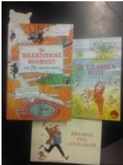
.....kinderboeken week met nieuwe boekjes....