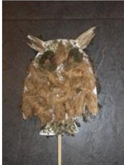
Woensdagmiddag 26 september, " september stempelen"