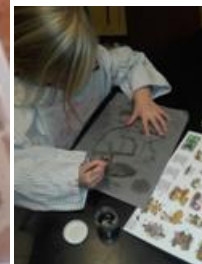
Paddenstoelen nader bekeken...de inktzwam...en tekenen met de inkt!