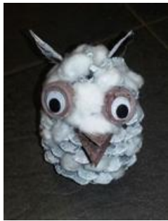
.....de sneeuwuil en..

Wat hebben we zoal gedaan.....wat gaan we nog doen: