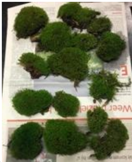
ijspegels uit een eierendoos.....een bos van mos van het dak....