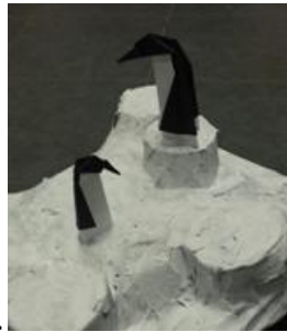
.... pinguins op de Zuidpool..