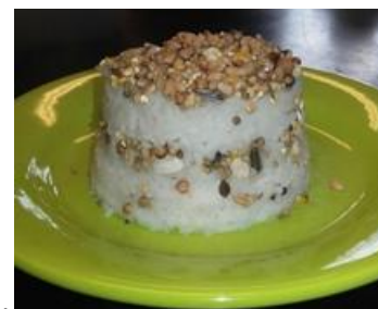
bos.....voor de vogels..... gebak!.....